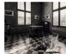
Mostra. Rinviata a tempi migliori

Tutto era pronto per sabato 14 novembre, tutto si è fermato causa Covid-19, ma nulla è perduto, basterà pazientare ancora