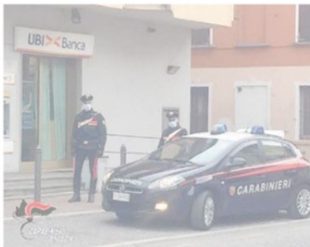
Appostati. I carabinieri fuori dall'ultima banca rapinata

Ieri, invece, non è andato tutto secondo i piani: ad attenderlo in strada c'erano i carabinieri, che lo hanno immobilizzato e gli hanno messo le manette ai polsi. D'altro canto i colpi del ragazzo erano ormai diventati prevedibili e i militari lo aspettavano al varco. In precedenza, il 30 ottobre, aveva rapinato anche la filiale della Bcc Agrobresciano di via Kennedy, a Visano, rubando un migliaio di euro sempre usando un tagliere come arma, come hanno ricostruito le indagini condotte dai militari di Desenzano in collaborazione con i colleghi di Verolanuova e come accertato tra l'altro dai filmati delle telecamere di videosorveglianza degli istituti bancari presi d'assalto. Con l'ultimo colpo, tali scorribande nelle banche del territorio si sono dunque concluse. //